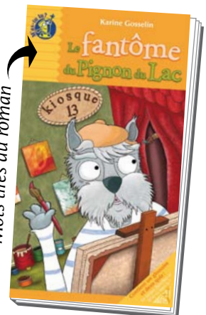
Mots tirés du roman

Solutions: 1. pinceau 2. radio 3. symposium 4. poisson-hérisson