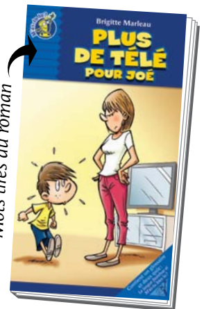
Mots tirés du roman

Solutions : 1-transporter 2-échelle 3-lettre 4-table 5-vélo 6-idée 7-sermaine 8-Il 9-oreiller 10-nuit Le mot caché est « télévision ».