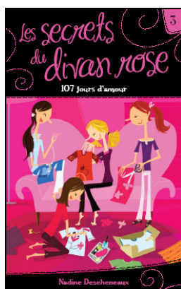
Trois boutons ISBN : 9782895954583