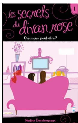
Oui, non ... peut-être ? ISBN : 9782895954569

Chaque vendredi soir, quatre copines se rencontrent et se révèlent leurs secrets, réinventent le monde et placotent sans retenue sur un divan rose. Si ce divan pouvait parler, il en aurait des secrets à révéler...