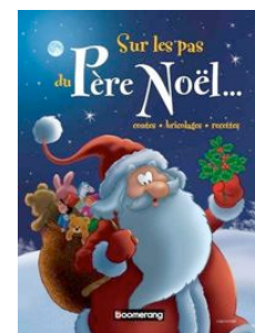
Sur les pas du Père Noël... 9782895955429