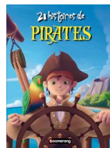
21 histoires de pirates 9782895955542