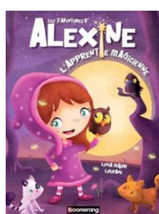
Les 7 aventures d'Alexine l'apprentie magicienne 9782895955665