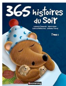
365 histoires du soir t.1 9782895955238